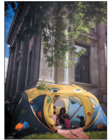
La tente Groâ devant la bibliothèque Maisonneuve.